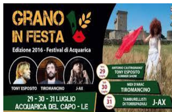
Festa del grano ad Acquarica (LE) – edizione del 2016

L'evento ha attirato negli ultimi anni migliaia di visitatori e si è messo in evidenza come uno dei più apprezzati e di successo, sia tra la popolazione autoctona sia tra gli ospiti in vacanza nel Salento durante il periodo estivo. Ogni anno durante la sagra vengono installate alcune opere e raffigurazioni dell'arte fatte di paglia, impressionante esempio ne è la Taranta che si abbarbica su una torre di vedetta situata in prossimità del luogo ove la Sagra si svolge. Tra le opere in paglia vi è anche la figura de La Fenice, un'altra icona appartenente alla tradizione e alle credenze popolari salentine, questa infatti viene simbolicamente incendiata al termine della manifestazione