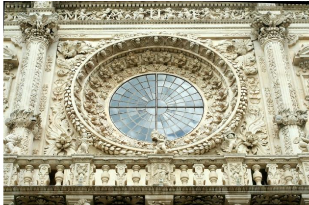
Esempio di Barocco leccese – Dettaglio del Rosone della Basilica di Santa Croce in Lecce

Riguardo all'occupazione, in provincia di Lecce si registra nel medio termine una riduzione del numero di occupati e un aumento dei disoccupati, in analogia con quanto osservato sull'intero territorio nazionale. Tuttavia, nell'ultimo biennio, si registra una sostanziale stabilità determinata da una variazione positiva del numero dei lavoratori nell'industria, in particolare in quella manifatturiera, che ha compensato positivamente le flessioni registrate nei settori dei servizi e dell'agricoltura.