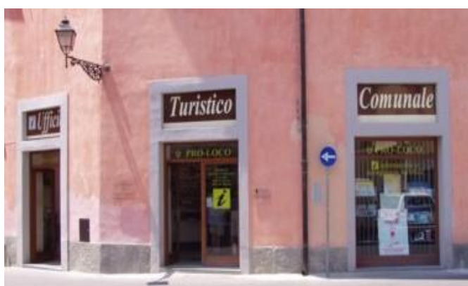
Sportello turistico culturale di una Pro Loco