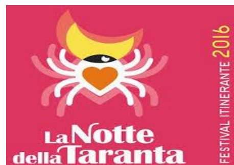
La notte della Taranta – edizione 2016 – la vera “pizzica” leccese