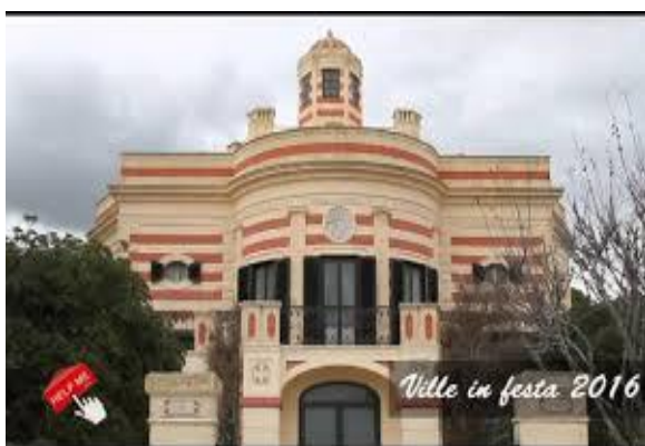
Ville in festa – S.Maria di Leuca